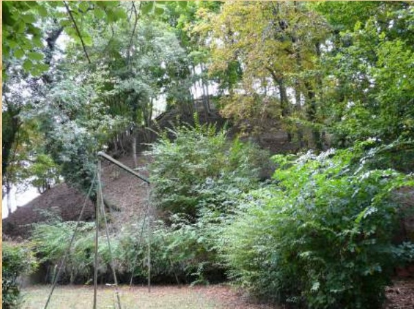
La motte castrale de Villars

La motte de Villars-les-Dombes était à l'origine située en périphérie du village, mais se trouve aujourd'hui en plein cœur du bourg. Ses dimensions imposantes (environ 15 m de haut, 65 m de diamètre à sa base et 15 m de diamètre en son sommet pour un volume de 15 000 m 3 ) en font l'une des mottes castrales les mieux conservées en Dombes.