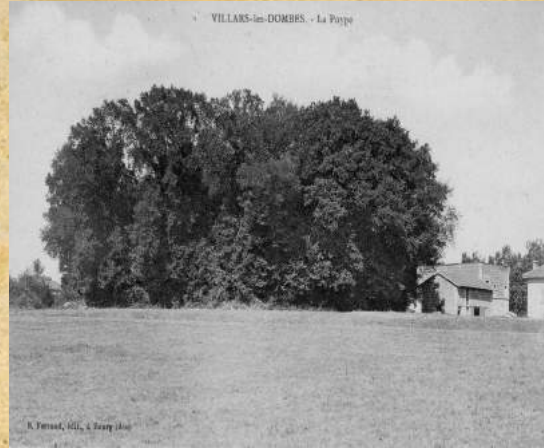
Carte postale du début du XXe siècle Archives départementales de l'Ain, 5 Fi non coté

La poype de Villars attise la curiosité des scientifiques et érudits locaux depuis fort longtemps. Les premières fouilles entreprises par F. Collet en 1897, dont le résultat fut publié dans le bulletin de la Société d'Emulation de l'Ain (1898), ont révélé l'existence d'une église enterrée au cœur même de la motte. Un nouveau chantier de fouilles est ouvert en 1988, dirigé par Jean-Michel Poisson (centre interuniversitaire d'histoire et d'archéologie médiévales, Lyon II).